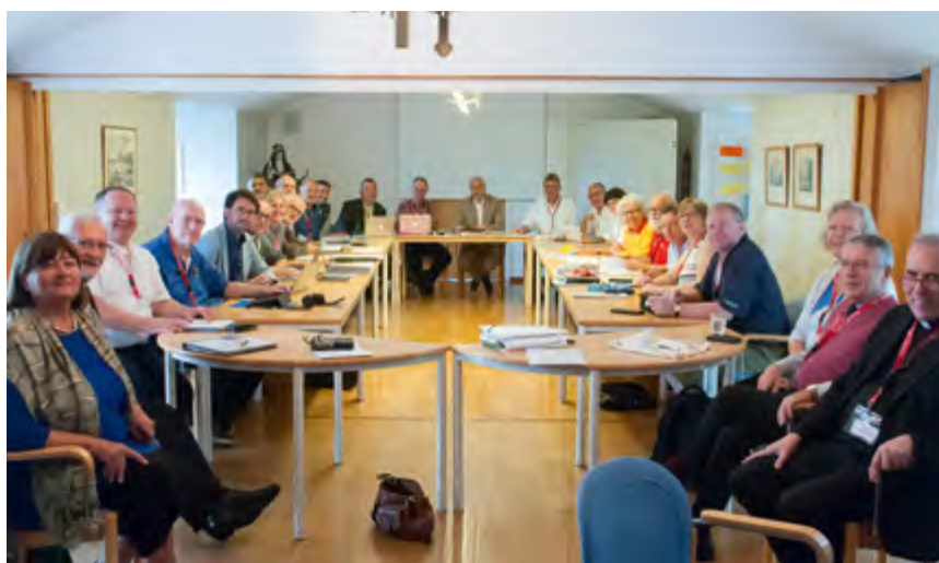
Oben links: 2019 erschienen – Das neue Chorbuch „Unsere Quelle bist Du“. Oben rechts: Die Teilnehmenden der Generalversammlung des internationalen Verbandes Pueri Cantores.