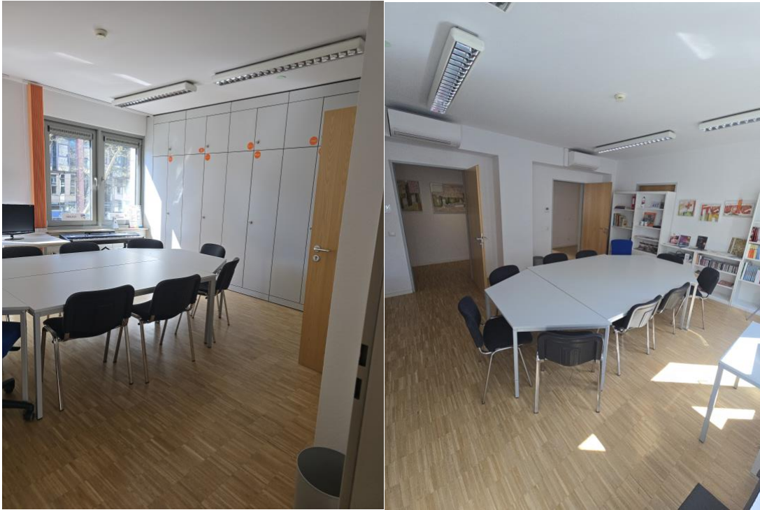
Großer Raum, 27qm