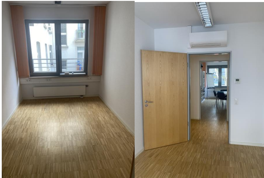
Zusätzlicher Büroraum 10qm (optional, mit Aufpreis)